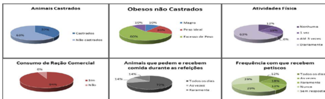
Figura 1 – resultados obtidos na entrevista aos proprietários das fêmeas atendidas (n = 16)

em função das alterações hormonais provocadas pela extirpação das gônadas sexuais. Do total de animais, 62% não são ovariectomizados. Sendo que destes, 60% prenominam com excesso de peso. Em relação à atividade física como andar, correr ou brincar, 63% dos animais foram relatados por seus proprietários que fazem exercícios diariamente. A maioria predominante, 94%, alimenta-se de ração comercial e 44% com fornecimento à vontade. Do total analisado, 44% pedem comida durante as refeições de seus proprietários; destes, 71% recebem esses alimentos todos os dias. De todos os entrevistados apenas um animal nunca recebe petiscos (Figura 1). Dos animais castrados, 73% destes são obesos e são submetidos a dietas contendo comida caseira, petiscos e ficam próximo a seus proprietários durante suas refeições. Os dados obtidos permitem observar que há correlação entre obesidade e neoplasia mamária. Para Daleck et al (2008), existe um aumento significativo ao índice de predisposição de cadelas íntegras à neoplasia mamária, dependendo também da fase em que ocorreu a intervenção cirúrgica.