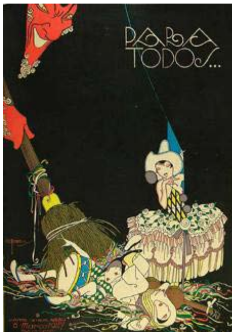
Figura 8 – Capa da Revista “Para Todos...”, edição de 5de Março de 1927.