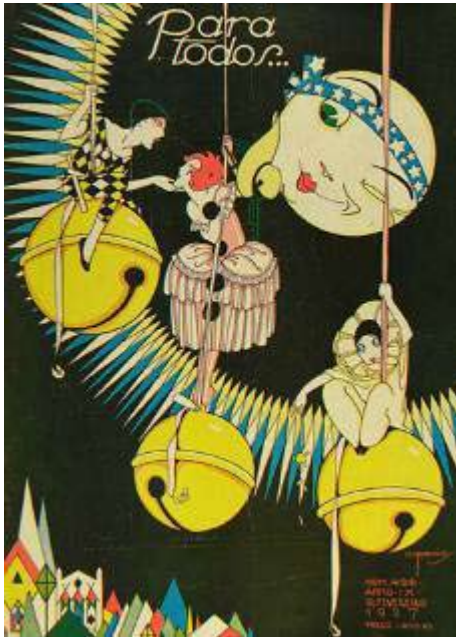
Figura 2 - Capa da Revista “Para Todos...”, edição de 12 de Fevereiro de 1927.