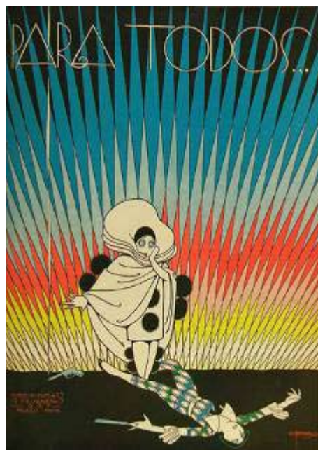
Figura 4 - Capa da Revista “Para Todos...”, edição de 19 de Fevereiro de 1927.